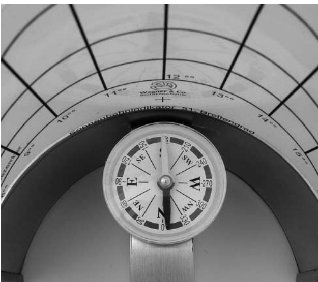
Bild 4 Den Sonnenbahnindikator mit dem Kompass nach Süden ausrichten und dabei möglichst waagrecht halten.