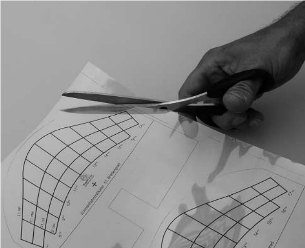
Bild 2 Die zutreffende Sonnenbahnfolie auswählen (51° Brg.= D, 48°-Brg.= D-Süd, Österreich, Schweiz etc.), entlang den dünnen Markierungslinien ausschneiden und in den Edelstahlhalter einschieben.