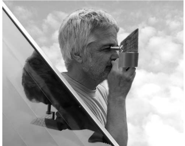
Bild 3 Den zukünftigen Standort der Solaranlage aufsuchen.