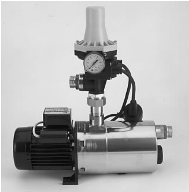
Bild 1 Hauswasserwerk RENOX